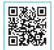
看護部以外申込 QRコードはこちら