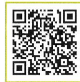
看護部申込 QRコードはこちら

詳細は当院ホームページをご覧ください。 不明な点は、総務課までお気軽にお問い合わせください。